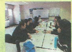
植栽デザイン決め