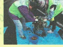
ハンギングバスケット植替え