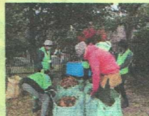
落ち葉堆肥づくり