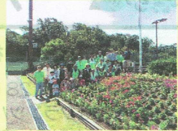
植栽イベント：みんなで植えよう応援花