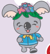
千種区マスコットキャラクター「こあらっち」

コースを歩いてクイズに答えてね。答えていただいた方には、賞品をプレゼント!(先着300人)